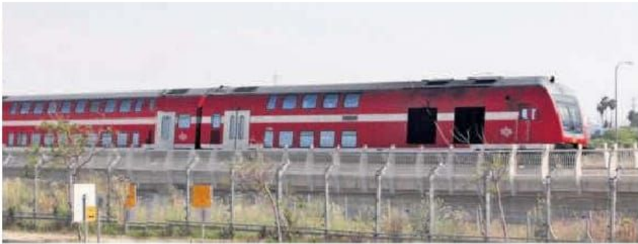
חסילה של רכבת ישראל. "לא ויתרנו"