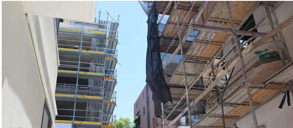
חדש - תקן אירופי